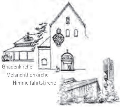
Gnadekirche Melanchthonkirche Himmelfahrtskirche

evangelisch in Buchenbühl und Ziegelstein