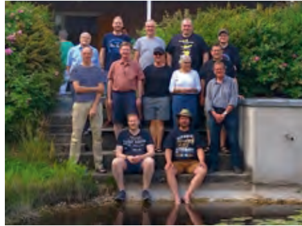
Der Posaunenchor 2023 am Hesselberg

oder per Mail an: obmann@posaunenchor-ziegelstein.de