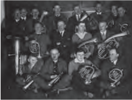
Der Posaunenchor im Gründungsjahr 1924

Infos und Anmeldung unter: www.posaunenchor-ziegelstein.de