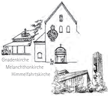
Gnadenskirche Melanchthonkirche Himmelfahrtskirche

evangelisch in Buchenbühl und Ziegelstein