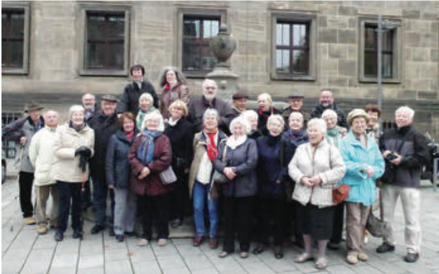
Dresden Semperoper - vor der Heimreise

Ein Konzert mit Variationen aus der Natur, gespielt auf der Sonnenorgel, erleben wir in St. Peter und Paul. Das heilige Grab ist ebenfalls eine Besonderheit, welche in der ausreichenden Freizeit besucht werden kann. Über Niesky geht die Fahrt wieder zum Hotel.