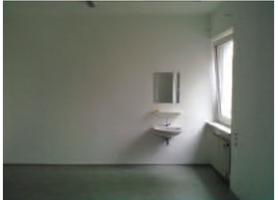
Ist das ein Anfang...?

Mögen wir erfinderisch werden im Teilen und Teilhaben lassen, denn wir sind alle Teil dieser Einen Welt!