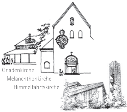
Gnadengemeinde Melanchthongemeinde Himmelfahrtsgemeinde

evangelisch in Buchenbühl und Ziegelstein