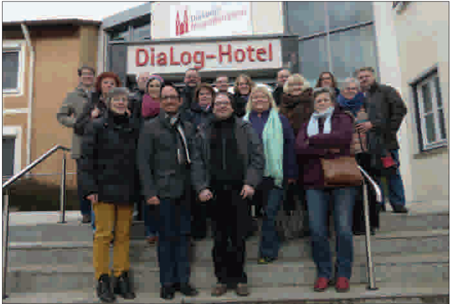
Kirchenvorstände im Dialog