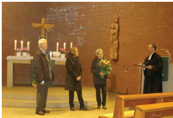
„Stabübergabe bei den Kirchenpflegerinnen“