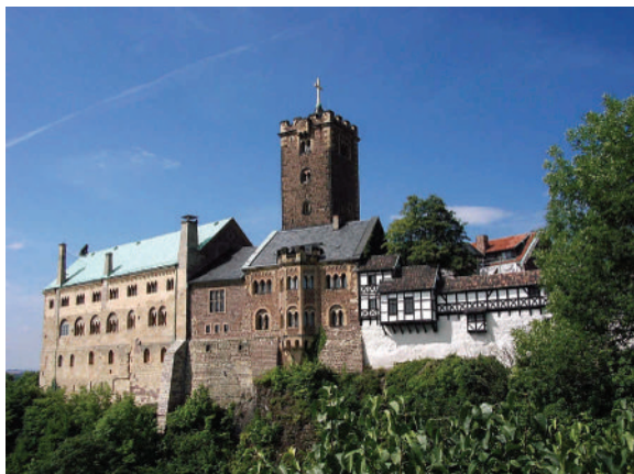
Die Wartburg: Foto:simon45/pixelio.de

Zu einem vorbereitenden Abend lade ich Sie am Donnerstag, 5. Juni um 19 Uhr ins Gemeindehaus Baiersdorfer Straße 10 in Buchenbühl ein.